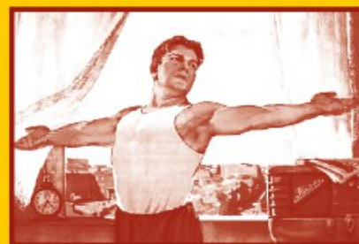
Ведите здоровый образ жизни