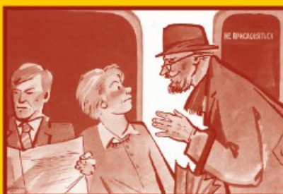
Ограничьте пребывание в местах скопления людей