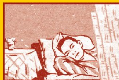
Избегайте контактов с заболевшими