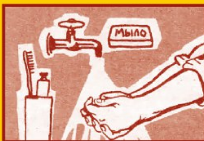
Регулярно мойте руки